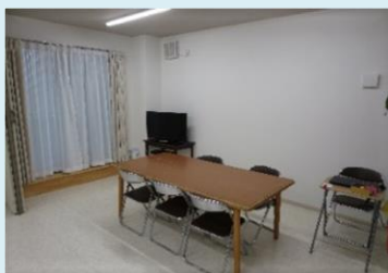
アザレアフォルテの 自立訓練室です

アザレアフォルテに来ることで外出する機会をつくります。 自宅以外の場所で過ごしたり、他の人と話したりすることから始められます。 これからの生活についてスタッフと一緒に考えることもできます。